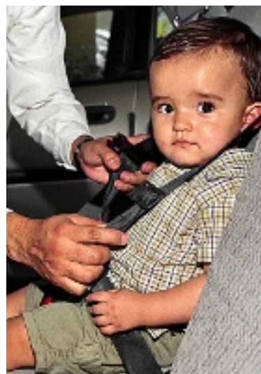
➤ Los niños más pequeños requieren de asientos y cinturones especiales.