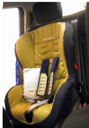
➤ Las sillas se adaptan en los anclajes de los autos.