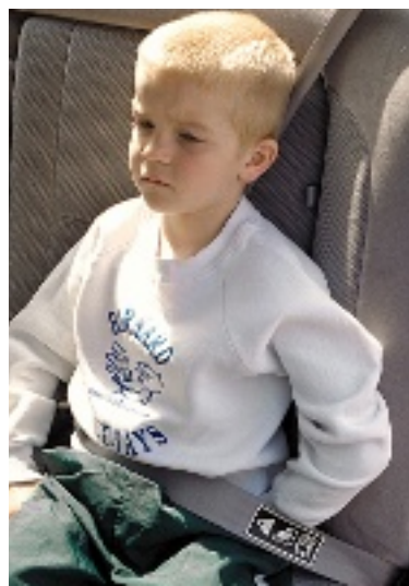
➤ Evite la mala colocación del cinturón de seguridad.

Los menores a 1 año ó 9 kilos de peso, deben ir en asientitos tipo portabebés (mismos que a la vez deben ir correctamente sujetos al auto) y con su cuerpo viendo hacia la parte trasera del auto. Es muy importante leer tanto el instructivo del fabricante de la sillita como el manual del propietario del auto, para estar seguros 100 por ciento de que lo estamos asegurando bien. Los niños mayores a 1 año y hasta los 4 ya pueden viajar viendo hacia el frente pero usando asientos especiales que se montan sobre el del auto y que vienen con un juego de cinturones comple-