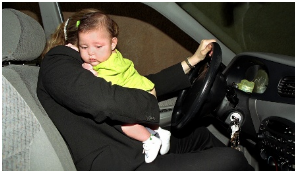
➤ Evite esta situación, no convierta a su bebé en un "baby bag", todo el impacto de un choque lo recibirá el pequeño.