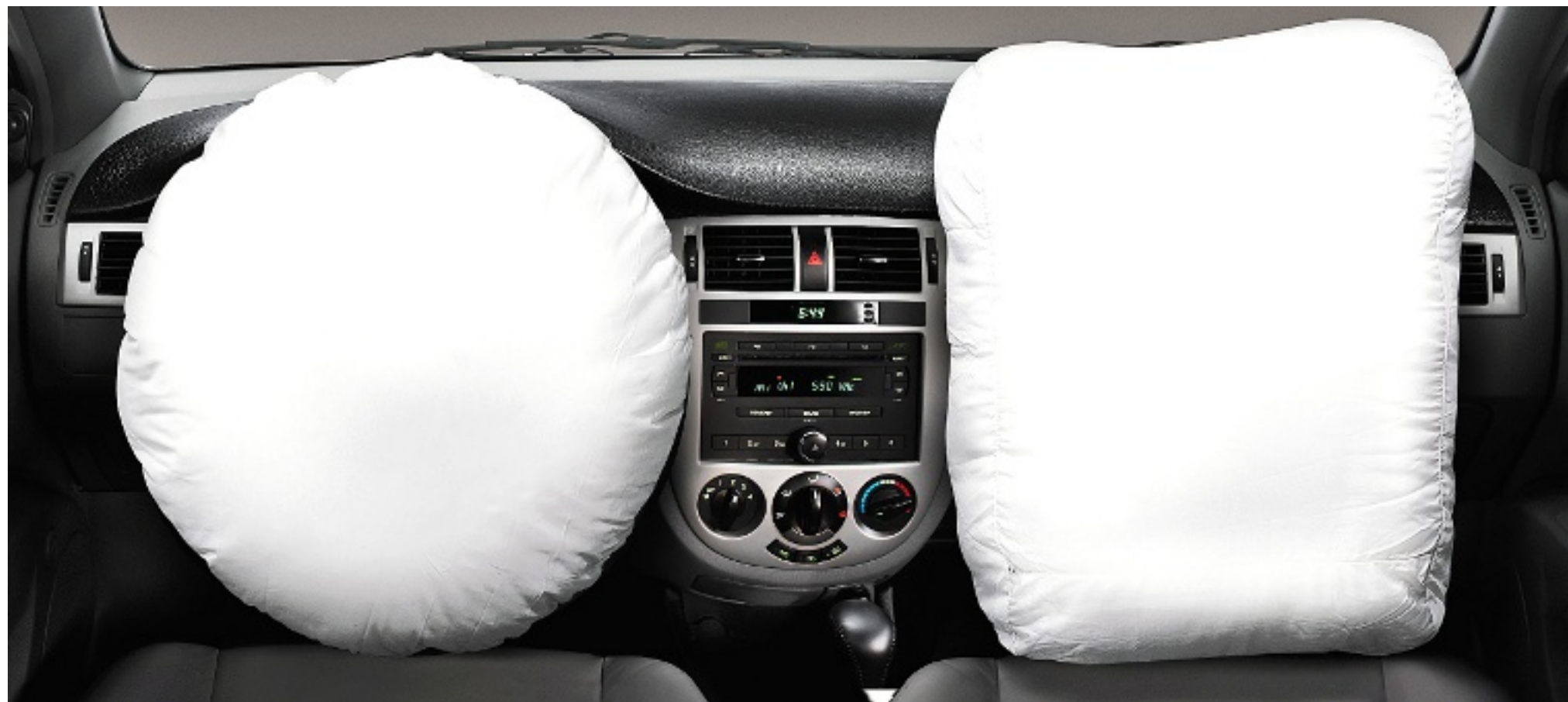
➤ Las bolsas de aire son dispositivos para proteger a los pasajeros en caso de colisión, sin embargo, por su fuerza de despliegue pueden resultar fatales para un infante.

Ahora imagine un impacto de esa magnitud sobre el cuerpo de su hijo. Incluso de usted mismo, por ello la recomendación es colocarse algo retirado de volante o del tablero. Y en caso de niños, que nunca viajen ade-